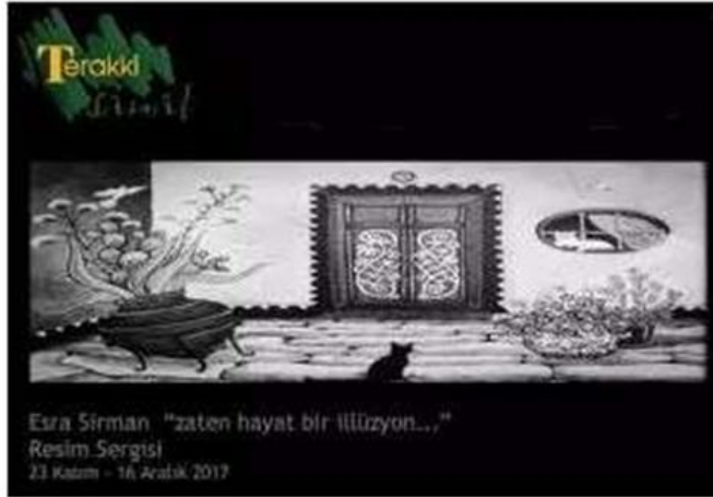
Esra Sirman "zaten hayat bir illüzyon..." Resim Sergisi 23 Kasım - 16 Aralık 2017

Esra Sirman "Zaten Hayat Bir İllüzyon" Resim Sergisi