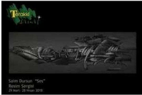
Saim Dursun "Ses" Resim Sergisi 29 Mart - 28 Nisan 2018